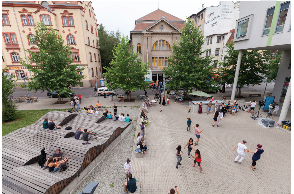
Piazzeta před Hraničářem během festivalu Léto na ulici