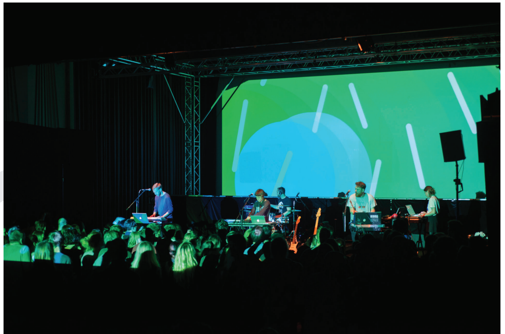
Midi Lidi a Mayen