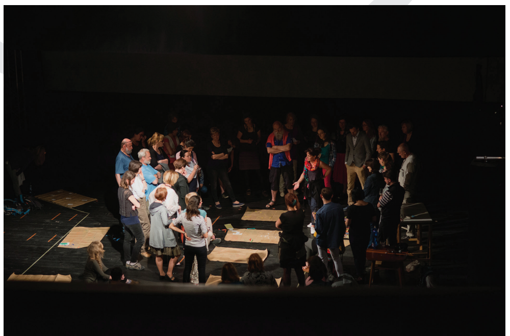
Světlo-obraz-zvuk. Seminář pro pedagogy